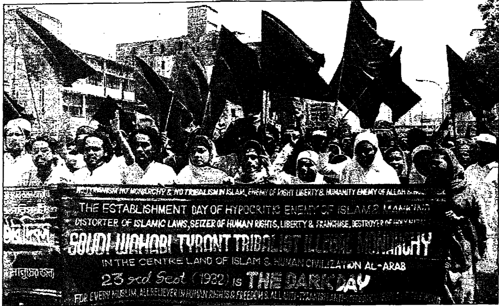
مظاهرة لحركة اسلامية في بنغلادش تزدحم هناك ضد الحكومة السعودية في مناسبة ذكرى انشاء المملكة